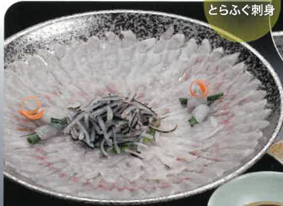
てっさ とらふぐ刺身