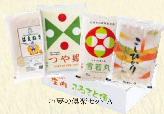
77) 夢の倶楽セット A