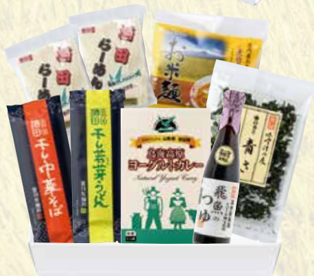
80) 夢の倶楽セット D