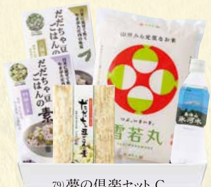
79) 夢の倶楽セット C