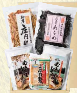
81) 夢の倶楽セット E