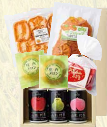
82) 夢の倶楽セット F

※ご希望に合わせた詰め合わせもいたします。 ※詰め合わせ内容により価格は異なります。