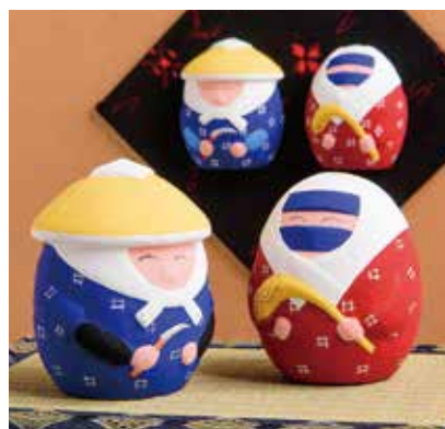
手づくり工房久松