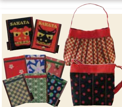
有限会社阿部彌太郎商店

65) 酒田光丘彫 お盆(1尺) 6,600円 茶托 菱形 5枚組 8,800円