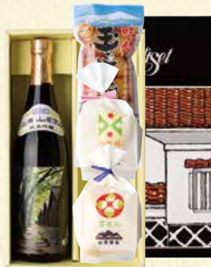
78) 夢の倶楽セット B