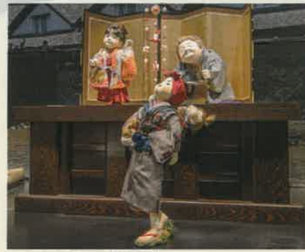
ミュージアム「おしん」人形ギャラリー