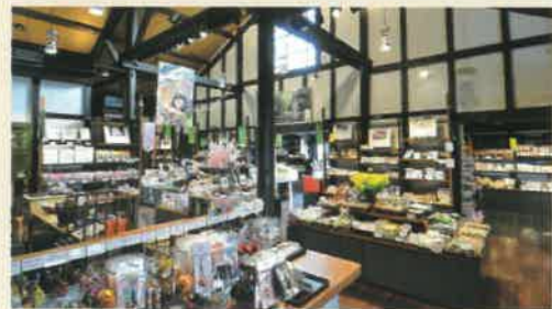
お土産販売コーナー