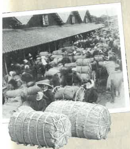
大正末頃、 倉庫に米を搬入する様子

酒田市のシンボリックな存在でもあるケヤキ並木と風格ある倉庫は観光の拠点としても利用され、また、NHKの連続テレビ小説「おしん」のロケ地としても知られています。