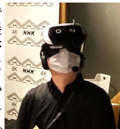
放送の未来を体験

③ NHK スペシャル特別映像とSDGs クイズ ④ 東京・渋谷で展示していたメディアアウオールで人気のNHK紅白歌合戦等の過去の番組の視聴など ⑤ チョちゃん&キョエちゃん人形の写真撮影など、盛りだくさん。