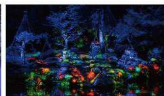
玉川寺プロジェクションマッピング