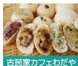
古民家カフェわだや