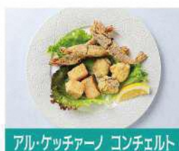
アル・ケッチャーノ コンチェルト