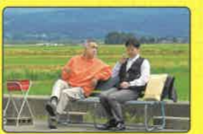
D JA斎ライスセンター 蕪木が勤めていた魚住食品の喫煙所 鶴岡市遠賀原字稲荷46-2