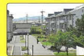
B 市営大山住宅 牧本・蕪木の家 鶴岡市平成町1-3