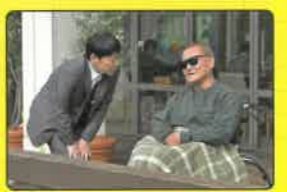
J 眺海の森さんさん 蕪木の知人が入居する老人ホーム 酒田市土洲大平1-59