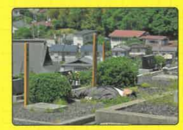
L 山形霊園 無縁墓地・牧本が購入した墓地 山形市飯田5-25-7(山形全図参照)