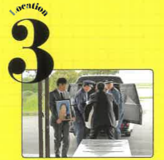
F 庄内町火葬場 牧本がおみおくりする火葬場 東田川郡庄内町余目石沢44-2 (鶴岡市地図参照)