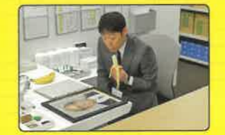
H 酒田市役所 牧本が働く庄内市役所 酒田市内本町2-2-45