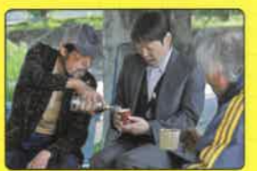
C 鼠ヶ関河川敷 蕪木を知るホームレスたちが集まり、生活している場 鶴岡市鼠ヶ関付近