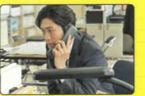
E 鶴岡市役所 温海庁舎 神代刑事が勤める警察署 鶴岡市温海577-1