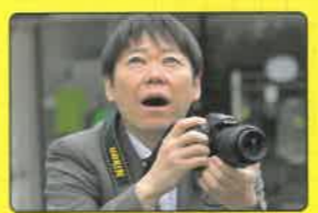
I カメラのトラヤ 牧本がカメラを購入したお店 酒田市中町2-4-30