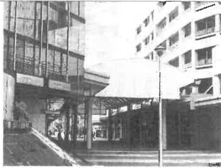
映画を見た後に必ず立ちたくなる、劇中登場した旧清水屋前

性や考え方を認められるか、「多様性の許容」です。「寅さん」や「トラック野郎」シリーズの様な温かさ、人情味を感じました。