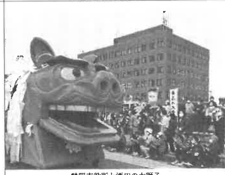
鶴岡市役所と酒田の大獅子

お城のお堀周辺を、致道館の前を酒田の大獅子、鶴岡の天狗山車、庄内町の姫龍が練り歩く光景は有名なテーマパークかハリウッド映画の様、またはそれ以上の光景でした。酒田まつり実行委員会、酒田市職員、酒田青年会議所、鶴岡青年会議所、地元企業の皆さん、ご協力ありがとうございました。