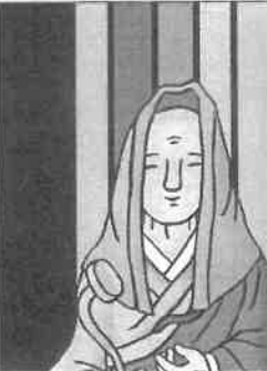
徳尼公の足跡を探り、物語を時代行列に