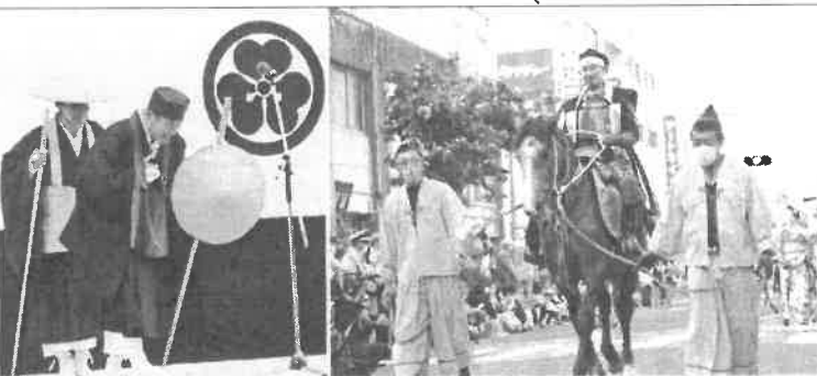
長谷堂合戦を思わせる武者(2枚)