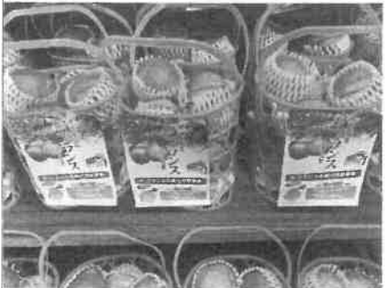
地方発送には箱詰め、お土産にはカゴ入りが人気

季節の話題としては、新米の売れ行きが好調で毎日の様に地方発送の注文が入っています。洋梨ラ・フランスも人気です。こだわりは「酒田で育ったラ・フランス」です。