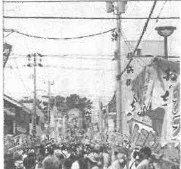
酒田まつり(露店を楽しむ市民)

感染拡大防止にご協力頂きながら三年ぶりに酒田の大型イベントを開催できました。歓声と皆さんの笑顔を見て「三年ぶりに開催できて本当に良かった」と実感しました。東北には、酒田にはハッキリとした四季があり、四季のお祭りがあります。私たちは五穀豊穡、商売繁盛を祈願し、大地や海の恵に感謝するサイクルを大切にしてきました。