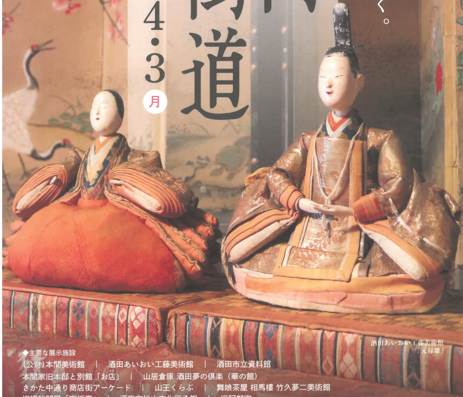
酒田あいおい工藤美術館 「元禄雛」