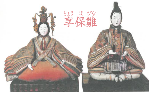
しょうほびな 享保雛

江戸時代中期に町家を中心に流行し、永く作られた雛人形です。大ぶりのものが多く、顔は面長で、能面のような表情をしています。故実に基づかない独創的な装束が特徴的です。