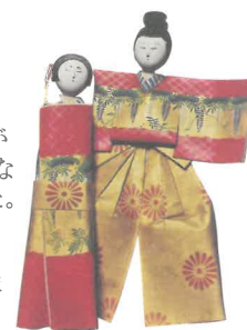
立雛 (次郎左衛門風)