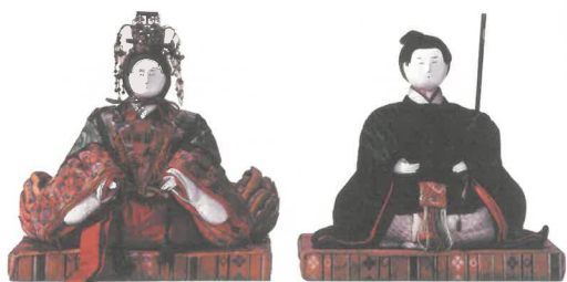
じろざえもんびな 次郎左衛門雛