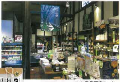
お土産品販売コーナー