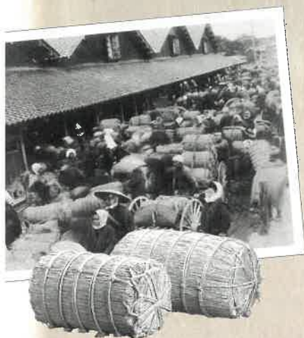
大正末頃、 倉庫に米を搬入する様子

当時の米の運搬は、船や馬車、荷車を利用した方法が多く、米俵をつんだ荷車が倉庫前で混み合っています。