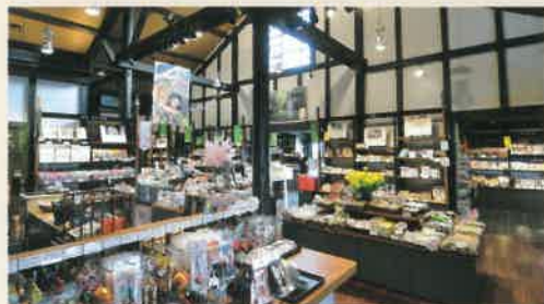
お土産品販売コーナー