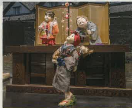
ミュージアム「おしん」人形キャラー