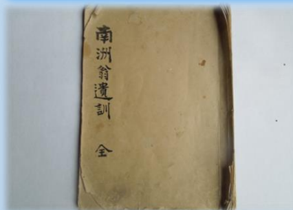
《南洲翁遺訓》 明治23年初版(菅家所蔵)