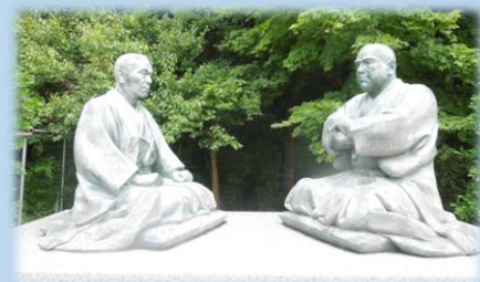
菅 実秀 西郷 隆盛 《徳の交わり》 南洲神社(酒田市)

主催：山形県庄内総合支庁 共催：鶴岡市 酒田市 三川町 庄内町 遊佐町 庄内観光コンベンション協会 後援：公益財団法人致道博物館 公益財団法人庄内南洲会 松ヶ岡開墾場 鶴岡「サムライゆかりのシルク」推進協議会