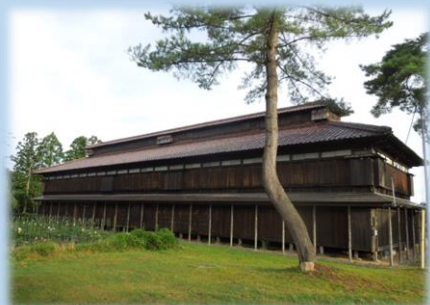
《日本遺産》 松ヶ岡開墾場(鶴岡市)